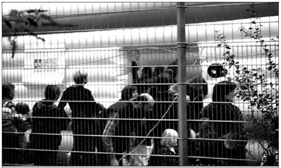
Die Baby-Notarztwagenhüpfburg macht Spaß.