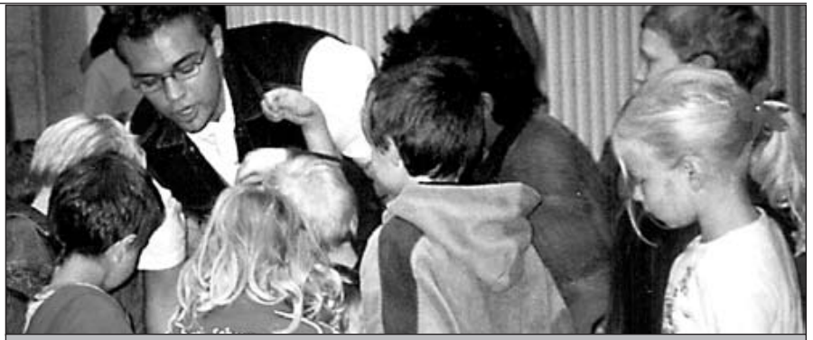
... und verblüfft die Gäste mit seinen Tricks.

Am Samstag, dem 8. Oktober, im Rahmen des Modaubrücklerfestes in Eberstadt hatte Groß und Klein Gelegenheit, die ASB-Kita zu besichtigen und sich über die Erziehungs- und Bildungsarbeit zu informieren.