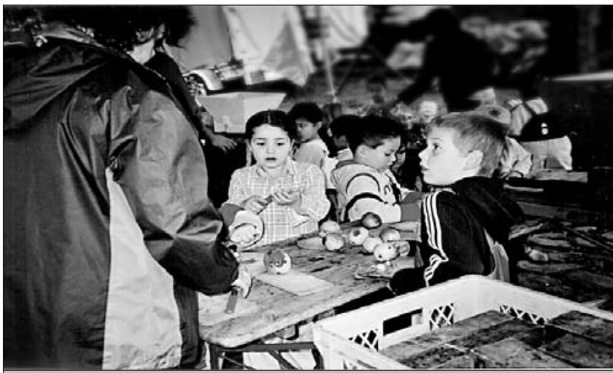
... faule Stellen ausschneiden