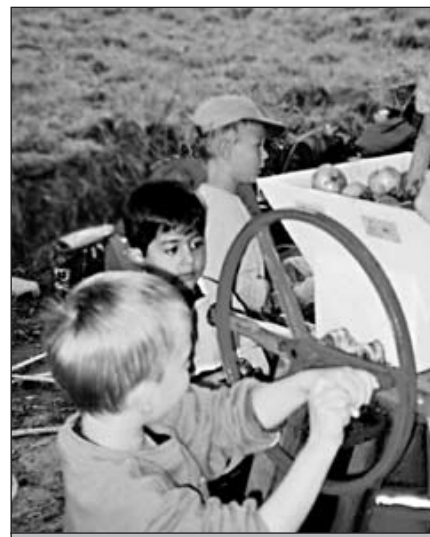
... Äpfel zerkleinern