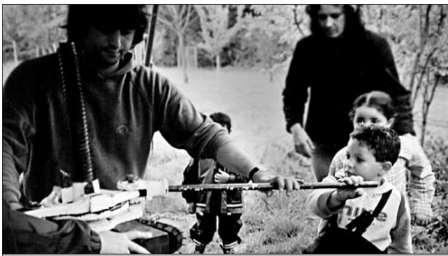
... und pressen