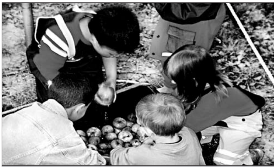
Vom Apfel zum Saft ... Äpfel sammeln und waschen...

Vier Tage entdeckten sie Neuigkeiten zum Beispiel einen Geheimgang oder dass Bachskorpione die Wasserqualität anzeigen. Die Kinder sammelten Nüsse, genossen den schier unbegrenzten Freiraum und kelterten eigenhändig Apfelsaft, wie die Bilderfolge beweist: