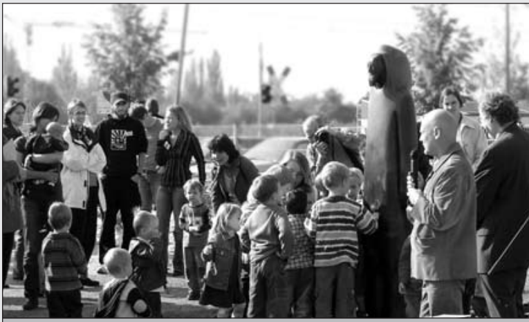
Eine Bronzeskulptur des Darmstädter Bildhauers Detlef Kraft ziert das Gelände der neuen ASB-Kindertagesstätte in Darmstadt-Kranichstein.