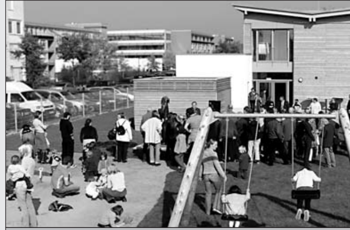
Zahlreiche Gäste aus der Politik, vom ASB und aus der Elternschaft nahmen an der Übergabe der KITA Papillon teil.