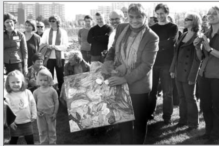
Jede KITA Gruppe übergab ein Bild an den Bauverein, die Stadt Darmstadt (auf dem Bild die Darmstädter Dezernentin Daniela Wagner), dem Künstler der Bronzeskulptur und dem Architekten der Einrichtung.