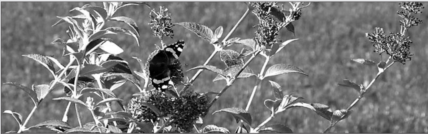
Ein Besucher machte dem Namen der neuen KITA alle Ehre – ein Schmetterling.