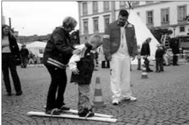
Alle Kinder konnten auf einem Parcours ihre Geschicklichkeit unter Beweis stellen.

„Alle Achtung! Kinder“ war das Motto des diesjährigen Weltkindertages zu dem auch in Darmstadt Aktionen geplant waren.