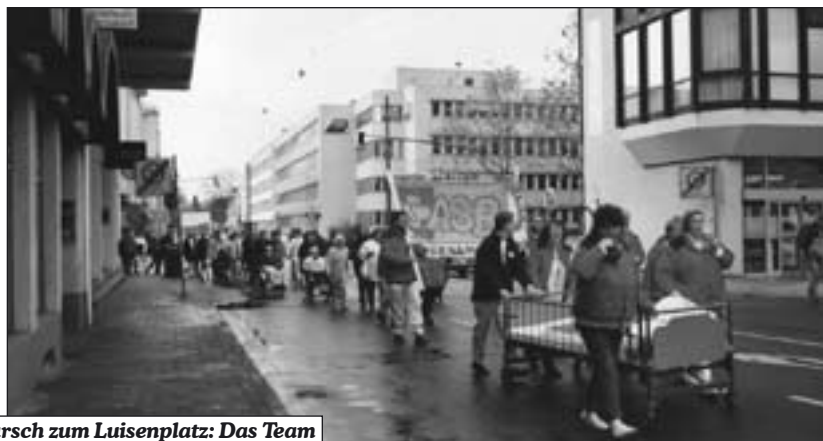
Sternmarsch zum Luisenplatz: Das Team der ASB Sozialstation war dabei.

Befragt wurden auch die Bundestagsabgeordneten, Andreas Storm (CDU) und Walter Hoffmann (SPD). Sie verwiesen auf die Wichtigkeit solcher Aktionstage für den Meinungsbildungsprozess in der Öffentlichkeit und der Politik. Beide Politiker verwiesen auf die Finanzierungsprobleme der sozialen Sicherungssysteme angesichts der konjunkturelle Krise unserer Volkswirtschaft.