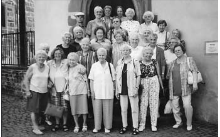
Die Seniorengymnastikgruppe des ASB: Seit sehr vielen Jahren ein eingespieltes Team!

Im Gasthaus stärkten wir uns und hatten dann Gelegenheit, Büdingen zu erkunden oder im Park spazieren zu gehen. Allzu schnell verging die Zeit. Der Ausklang unseres Tages fand auf der Ronneburg, die im