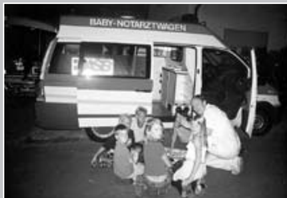
Die jüngsten Festteilnehmer schauten sich den Baby-NAW vor Ort ganz genau an.