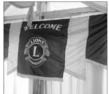
Der gespendete Beitrag ging an den Baby-Notarztwagen.

Der Vorstand des ASB Darmstadt-Starkenburg möchte sich deshalb noch einmal recht herzlich für die finanzielle Unterstützung des Baby-Notarztwagens durch die LIONS-Clubs Luise-Büchner und Castrum bedanken “Durch Ihr soziales Engagement haben Sie zur Sicherung dieser wichtigen Einrichtung einen großartigen Beitrag geleistet!” (gp.)