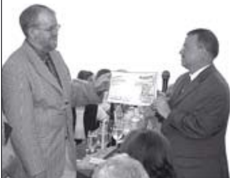
Die Organisatoren des Benefizturniers überreichen den Scheck über 10.000 Euro.