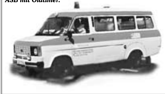
ASB mit Oldtimer.