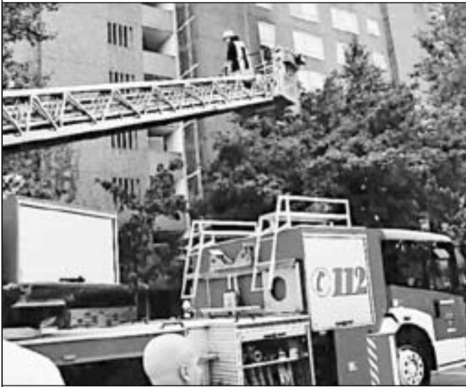
Die Feuerwehr mußte zur Rettung die Drehleiter einsetzen.