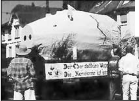
Der Namensgeber des Stadtteils, der Eber, wird über den Parcours gefahren.

Unfälle hatte das zum Sanitätsdienst eingeteilte DRK Eberstadt glücklicherweise nicht zu verzeichnen.