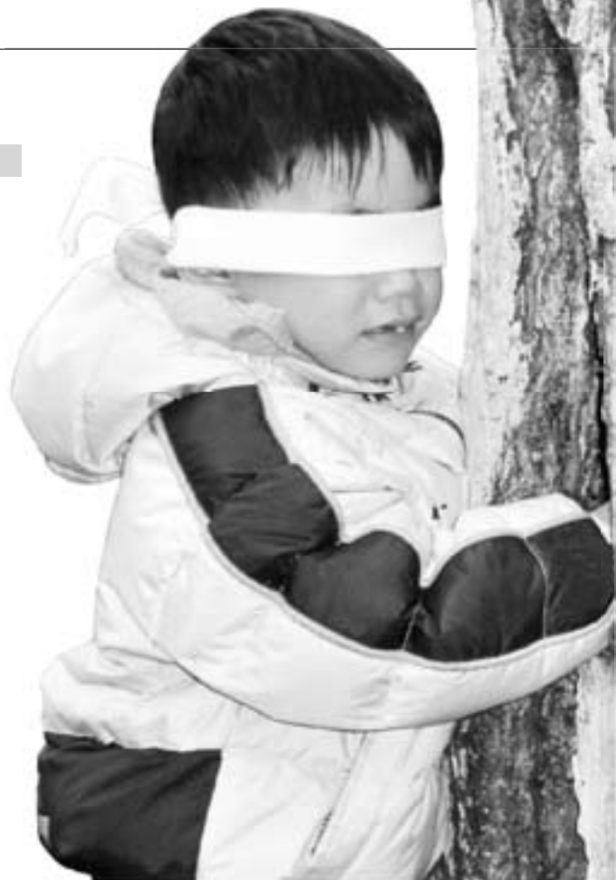
Ein Kind beim "Ertasten" eines Baumstammes.

Den Kindern wird neben vielfältigen Naturerfahrungen und Bewegungsmöglichkeiten auch Zeit und Raum gegeben, miteinander in Kontakt zu treten und neue Beziehungen zu Kindern und Erzieherinnen aufzubauen. Sie werden zum Erkunden, Experimentieren, Entdecken und Forschen angeregt und machen dabei selbstbestimmt Erfahrungen in und mit der Natur. Die Kinder untersuchen das Bachwasser und lernen so z.B. kleinste Lebewesen kennen, die sie durch Lupen beobachten. Sie spüren mit ihren Füßen die Unebenheiten des Waldbodens und den sandigen oder glitschigen Bachuntergrund. Sie erleben den Erfolg, wenn sie es geschafft haben, den "steilen" Abhang zu erklimmen und über umgefallene Baumstämme zu balancieren.