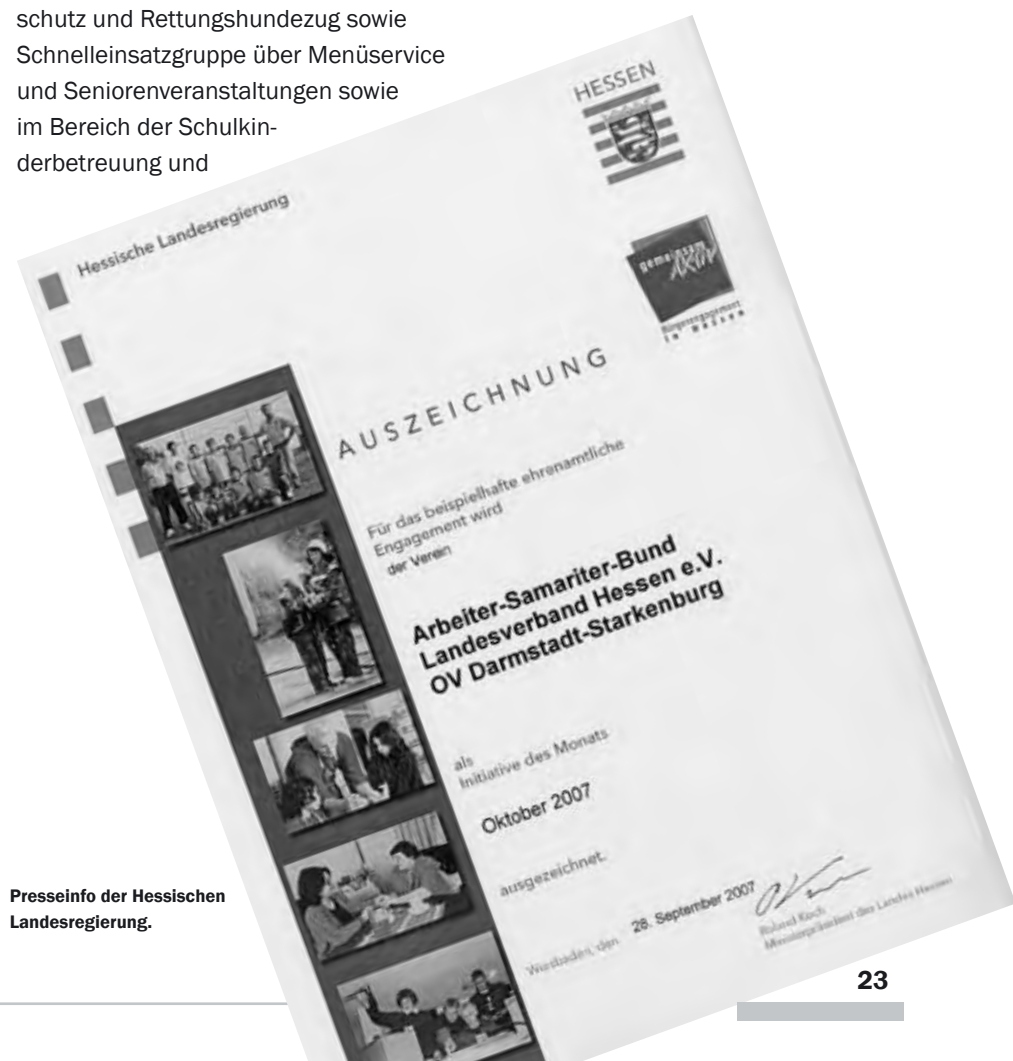
Presseinfo der Hessischen Landesregierung.

Staatssekretär Metz hob hervor, der Anerkennungsbeitrag sei ein symbolisches Dankeschön für das bisherige engagierte Wirken des „Arbeiter-Samariter-Bundes Darmstadt-Starken- burg“ und solle helfen, auch weiterhin in so ausgezeichnete Weise tätig zu sein. Weitere Informationen über den Ortsverband und seine Arbeit erhalten Sie im Internet unter www.asb-darmstadt.de .