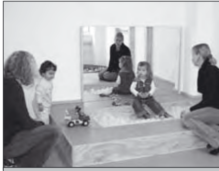
Erstes „Erproben“ der Spielpodeste.

Telefonisch, per Mail oder persönlich. Wenn wir aktuell keinen Platz frei haben (wie momentan der Fall) kann man sich auf die Vormerkliste (Warteliste) setzen lassen.