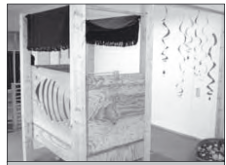
Die Kuschelhöhlen bieten Platz und Gelegenheit zum Rückzug und zur Ruhe.

Ihr Ansprechpartner: ASB Krippenhaus Julia Oberkönig Spreestraße 1 64295 Darmstadt Telefon 0 61 51/3 072 072 krippenhaus@asb-darmstadt.de