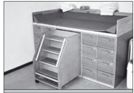
Selbst die Wickeltische sind auf das Erlernen der Selbstständigkeit „getrimmt“.

politische Debatte, befassen sich die Ausbildungsschulen für ErzieherInnen mit dieser Thematik und es werden passende Fort- und Weiterbildungsmaßnahmen angeboten. Sicherlich auch durch den hessischen Bildungsplan, denn Kleinkinder haben nicht nur ein Recht auf Betreuung, Erziehung und Pflege (wie lange Zeit angenommen wurde), sondern auch auf Bildung! Diese Möglichkeit bieten wir mit unserer Raumgestaltung und Materialien den Kindern.