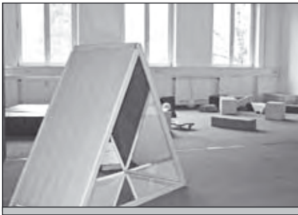
Auch im großen Bewegungsraum finden sich überall Spiegel und Hilfsmittel um die Kinder bei dem Erlernen ihrer Selbstständigkeit zu unterstützen.