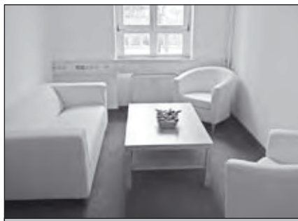
Der Eltern-Besprechungsraum schafft eine ruhige und angenehme Atmosphäre für Gespräche zwischen Erzieherinnen und Eltern.