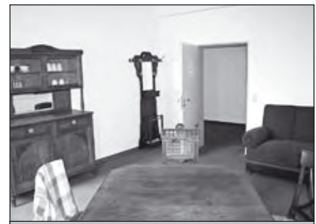
Im Elterncafe können sich Eltern zurückziehen und Informationen austauschen während ihre „Kleinen“ sich vergnügen.

Ihr Ansprechpartner: ASB Krippenhaus Julia Oberkönig Spreestraße 1 64295 Darmstadt Telefon 0 61 51/3 072 072 krippenhaus@asb-darmstadt.de