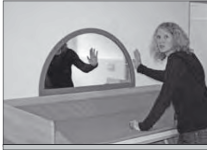
Die Spiegel helfen den Kindern beim „Selbst-Erfahren“.