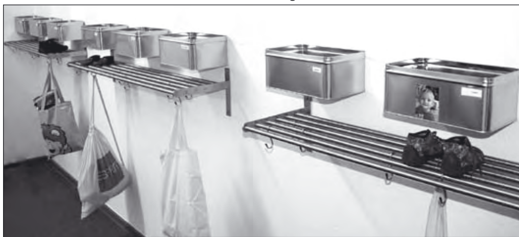
Jedes Kind hat seinen Platz für persönliche Dinge.