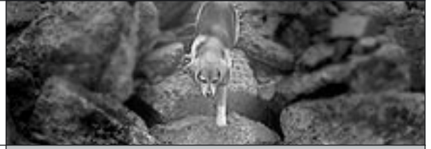
Panach: Unser Beagle bei seiner ersten Trümmerprüfung – bestanden!

An einem Samstag im April war es mal wieder soweit, unsere jährliche Flächenprüfung in einem unbekanntem Suchgebiet sollte stattfinden.