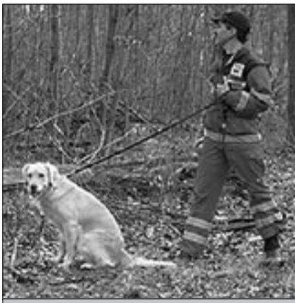
Barka: Konzentration vor der Prüfung.

Mit dem Kommando "Such und Hilf!" wurde um 9.00 Uhr die erste Prüfung begonnen. Es galt einen Ernstfall zu simulieren: Ein junger Mann, depressiv und suizidgefährdet sollte innerhalb von 20 Minuten in einem Waldgebiet auf der Ludwigshöhe in Darmstadt gefunden werden. Ein Team nach dem anderen