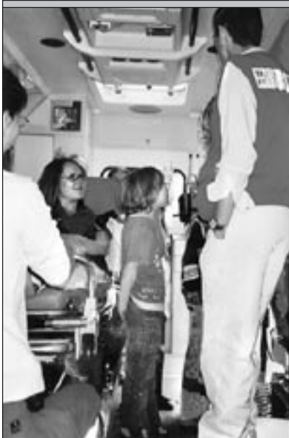
So sieht ein Rettungswagen innen aus!