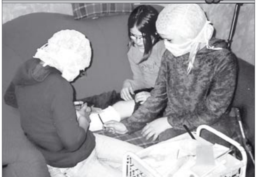
Arztpraxis im Wohnzimmer des Kinderhort Kita Modaubrücke.

Im Hort der Kindertagesstätte An der Modaubrücke vertiefen sich die Kinder seit den Osterferien in das Spielthema „Arztpraxis“. So haben sich Kreativraum und Wohnzimmer des Hortes in den letzten Wochen in ein Ärztehaus verwandelt. Material organisierten sich die Kinder unter anderem auch bei den umliegenden Arztpraxen in Ebertstadt, wo sie auf freundliches Entgegenkommen stießen. Nun werden in der Sprechstunde Termine vergeben, Gipsverbände angelegt und Operationen durchgeführt. Da lag natürlich auch ein Besuch bei der Rettungswacht des ASB nahe. Hier nahmen sich die Sanitäter Zeit, um den Kindern den Rettungswagen näher zu bringen.