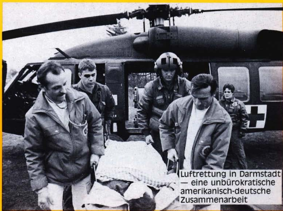
Luftrettung in Darmstadt — eine unbürokratische amerikanisch-deutsche Zusammenarbeit