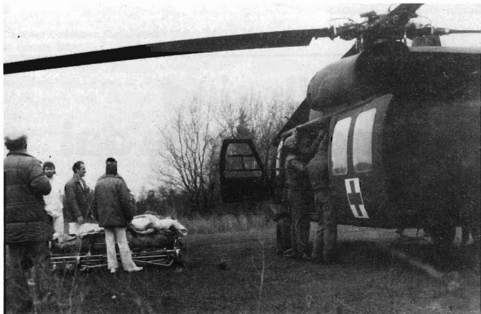
Die Darmstädter Besonderheit: jahrelange, reibungslose Zusammenarbeit zwischen Rettungsdienst und der Hubschrauberstaffel der US-Army.

Und was für Kerle das sind, das wollen wir Ihnen jetzt mal vor Augen führen: An einem leicht nebligen Abend zog es die beiden Verfasser vorliegender Lektüre gen Griesheim. Empfangen wer-